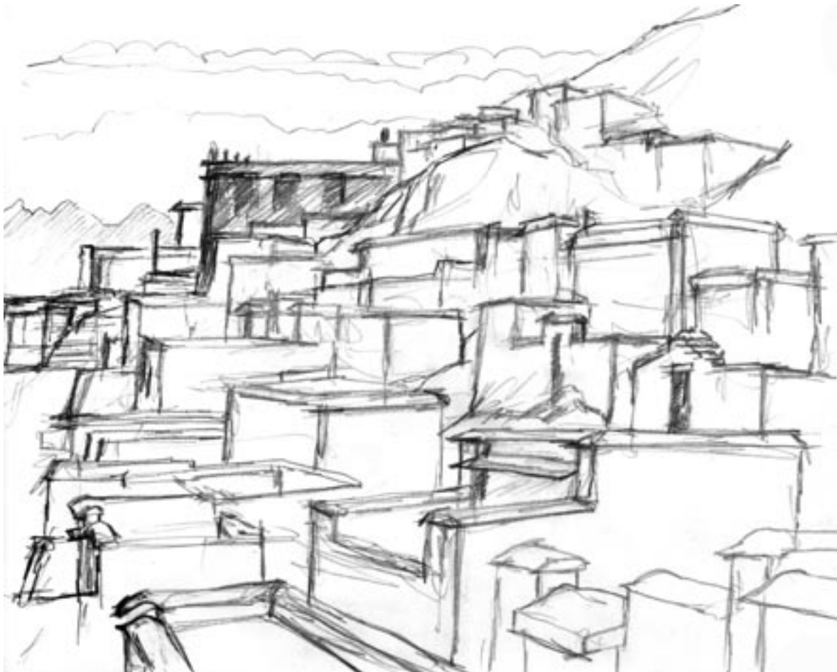
Galo Ani Gompa